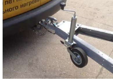
Прицеп оборудован: повторителями стоп сигналов и указателей поворота, номерным знаком и его подсветкой.