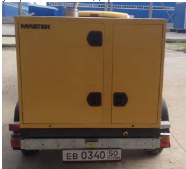
Дверцы отсеков оборудованы надежными замками под ключ, что обеспечивает сохранность узлов и агрегатов.