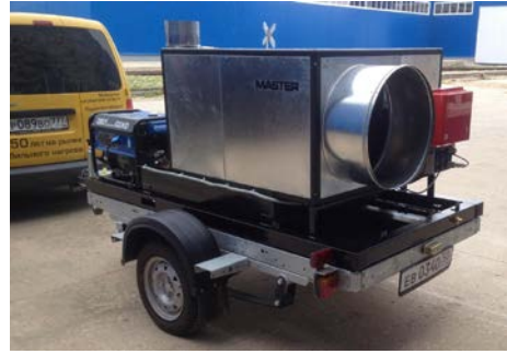
Кран и штуцер для слива топлива. Рекомендуется во время передвижения сливать топливо из бака.