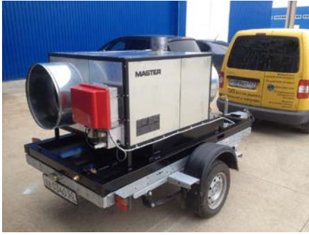
Green 470 с утеплением корпуса, горелка дизельная RG 3