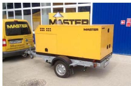
Бензиновый генератор Гeko с баком, позволяющим работать автономно до 11,5 часов.