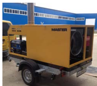
Верхний корпус съемный

Архангельск (8182)63-90-72 Астана +7(7172)727-132 Белгород (4722)40-23-64 Брянск (4832)59-03-52 Владивосток (423)249-28-31 Волгоград (844)278-03-48 Вологда (8172)26-41-59 Воронеж (473)204-51-73 Екатеринбург (343)384-55-89 Иваново (4932)77-34-06 Ижевск (3412)26-03-58 Казань (843)206-01-48