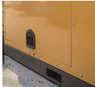
Предусмотрены отверстия под вилы погрузчика. Модуль можно поднимать так же краном.